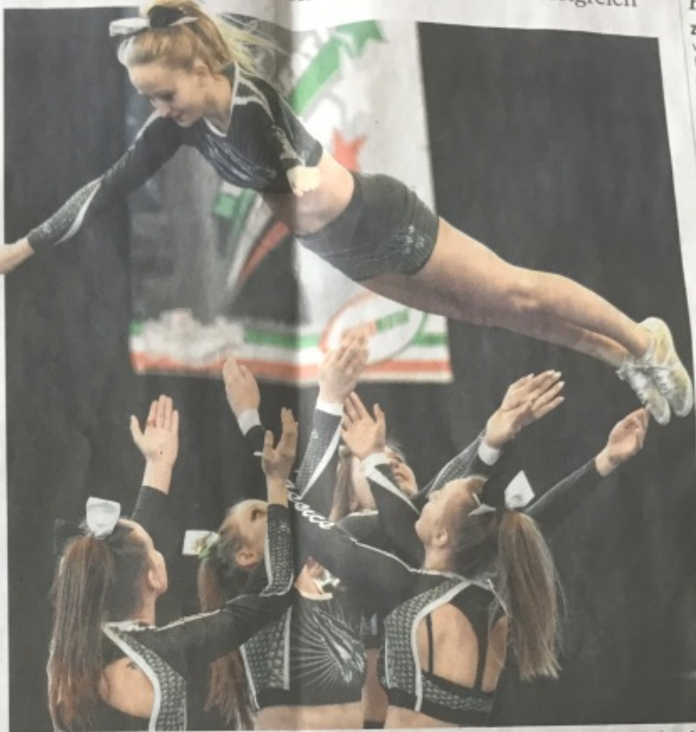
Einmal durch die Luft wirbeln? Kein Problem für die Senior Jurassics aus Rheine. Zur 26. Cheer und Cheerdance Landesmeisterschaft traten mehrere hundert Tänzerinnen und Tänzer in der Halle Schürenkamp an.

Die Einzelkategorie gehört zum Cheerleading genau wie die Gruppenvorführungen in verschiedenen Formationen. Da gibt es „Double-Dancers“, „Group Stunt Teams“ zu fünf, und „All“-Gruppen in verschiedenen Altersklassen und bis zu 25 Teilnehmern. Was sie vereint? Schicke Teamkleidung in den Vereinsfarben, Pferdeschwänze mit Schleifen im Haar und vor allem strahlendes Lachen auch bei den wildesten Wurf- und Sprungelementen.