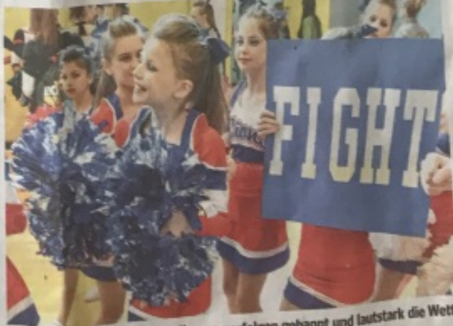
Auch die Cheeky Lions aus Delhoven verfolgen gebannt und lautstark die Wettkämpfe. Kräftiges Mutmachen bei den Akteuren ist Ehrensache.